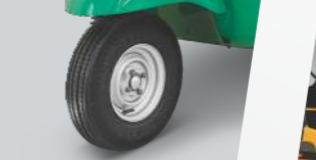
3 ವೀಲರ್ ಸೆಗ್ಮೆಂಟ್‌ನಲ್ಲಿ ಮೊಟ್ಟಮೊದಲ ಟ್ಯೂಬ್‌ಲೆಸ್ ಟಾಯರ್‌ಗಳು